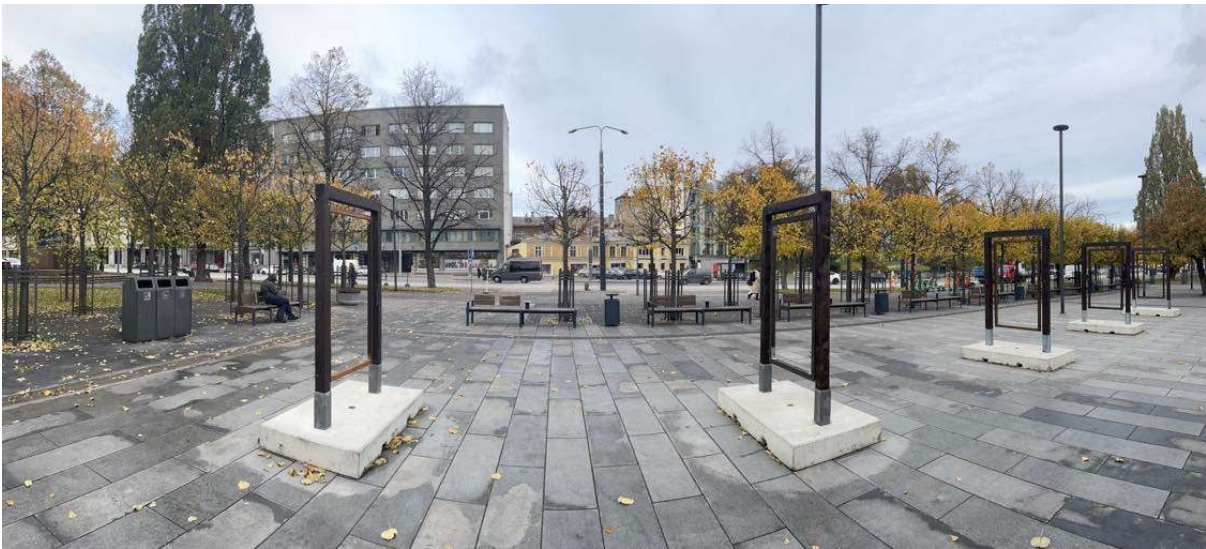
Panoraamvaade Tammsaare pargi Uue turu osa keskeljelt suunaga Estonia teatrist vanalinna poole.

Alapeatükk 2.1 „Tallinn kuulub UNESCO maailmapärandi nimekirja 1997. aastast. Nimekirja pääsemise eelduseks on esitatud paiga erakordne ülemaailmne väärtus (ingl outstanding universal value ehk OUV), mis tähendab objekti kuulumist kõige silmapaistvama kultuuripärandi hulka ülemaailmses mastaabis.”