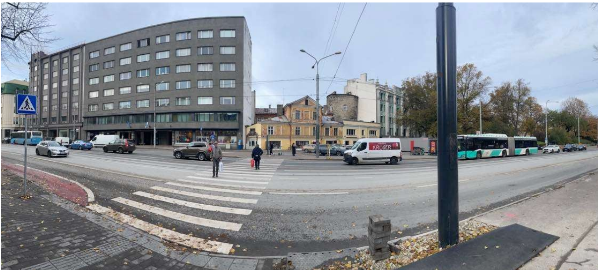
Panoraamvaade Pärnu maantee servast vaatega Estonia teatri poolt vanalinna suunas ei muutuks juurdeehituse tõttu vähimalgi määral.