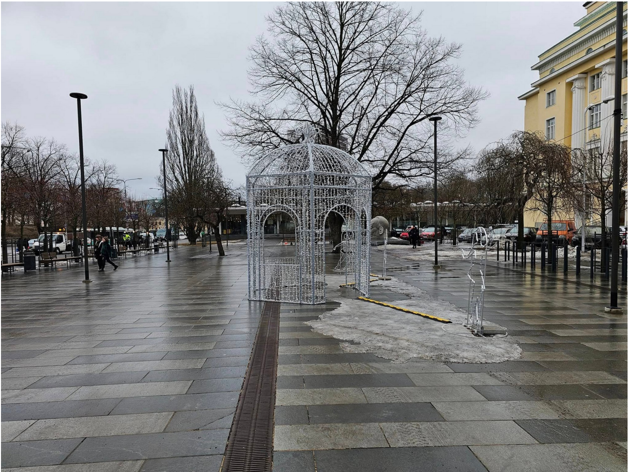
Vaade erakordsele ülemaailmsele väärtusele.